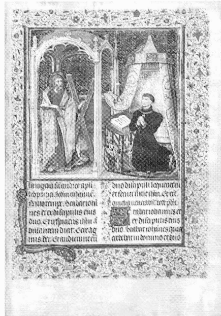
Officie van Sint Andreas. (Brussel, Koninklijke Bibliotheek Albert I, Ms 9511, fol. 398r). Te zien in BRUSSEL (Gulden Vlies)

UTRECHT Museum Catharijneconvent: Het Utrechts Psalter. Middeleeuwse meesterwerken rond een beroemd handschrift. 31 augustus - 17 november. Met publicatie en CD-Rom (zie ook VARIA).