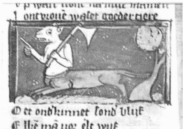
Jacob van Maerlant, Der Naturen bloeme. Vlaanderen of Zuid-Holland, ca 1285? (Demold, Landesbibliothek, Ms. 70, fol. 40v). Te zien in DEN HAAG.

Van 4-7 juli 1997 zal te Cambridge de vijfde jaarlijkse conferentie van de 'Society for the History of Authorship, Reading and Publishing' plaats vinden. Tot 20 november kan men voorstellen voor papers indienen bij de 'Acting Secretary', SHARP Conference Programme Committee, 51 Sherlock Close, GB-Cambridge CB3 0HP.